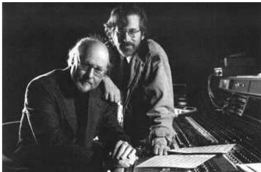
Williams y Spielberg, dos genios juntos.

1982 fue el año de “ET. El extraterrestre”. La película preferida de muchos niños llevaba una banda sonora de las de poner los pelos de punta y hacernos un nudo en la garganta junto a esa tierna historia magistralmente dirigida por Spielberg. “ET” sí recibiría tanto el Oscar como el Globo de Oro.