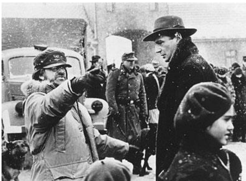
La lista de Spielberg

Y vaya que si impacta esta necesaria película en la que sus tres horas no pueden dejar indiferentes a nadie. Por momentos nos avergüenza de nuestra propia raza al mostrarnos mejor que cualquier otro documento la sinrazón del nazismo, al que le dio por los judíos como pudo darle por otros... pero también nos enorgullece por personas como ese Oskar Schindler cuyos restos descansan en Jerusalén, donde también hay un árbol plantado en su honor en la Avenida de los Justos... y también nos brinda este pelicolón el, en mi opinión, más bello final de la historia del cine.